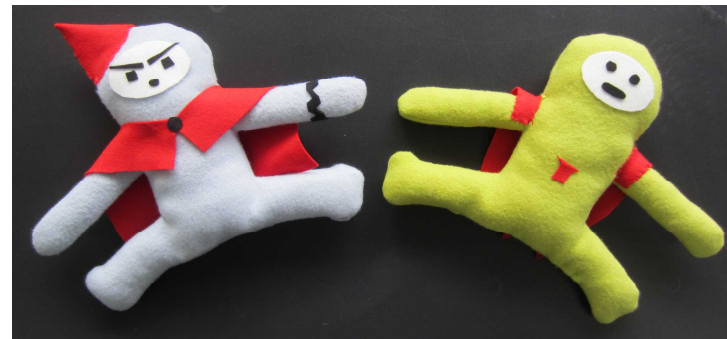
家庭科生徒作品「ぬいぐるみ」