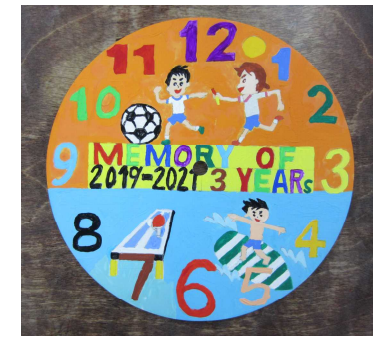
美術科生徒作品「時計」