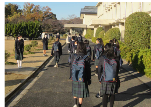
朝の選挙活動の様子